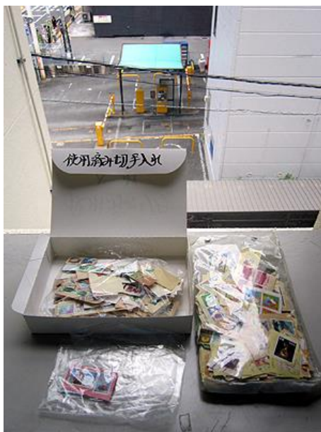
集まった使用済み切手