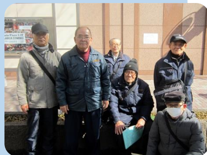
駐輪場管理で一緒に働く会員の皆さん 中央区 誓園公園にて撮影