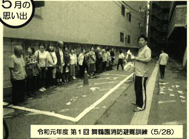
令和元年度 第1回 舞鶴園消防避難訓練 (5/28)