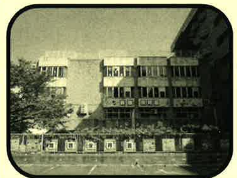
老人福祉センター舞鶴園 外観写真

「高齢者保健福祉のあらしみ 平成29年度版 編集：福岡市保健福祉局介護福祉課」より