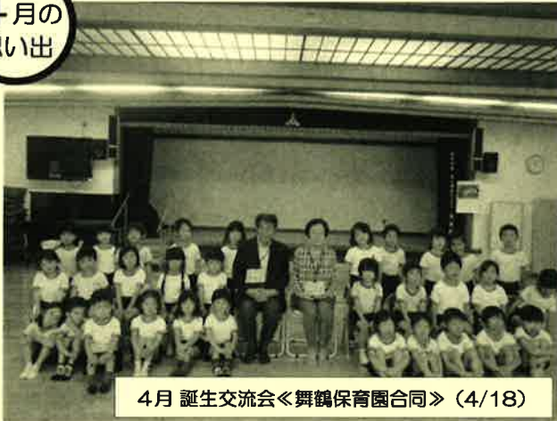
4月 誕生交流会<舞鶴保育園合同> (4/18)