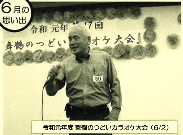
令和元年度 舞鶴のつどいカラオケ大会 (6/2)